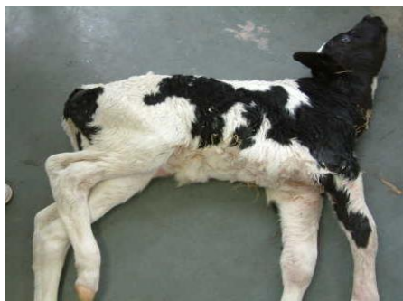
神経症状による起立不能