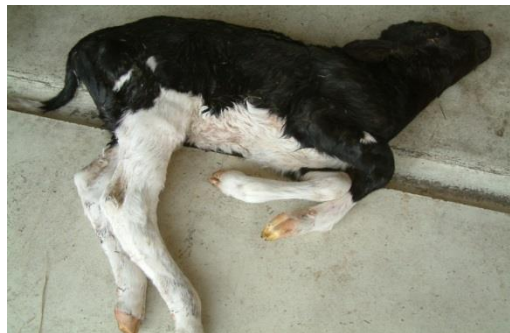
両前肢の関節拘縮