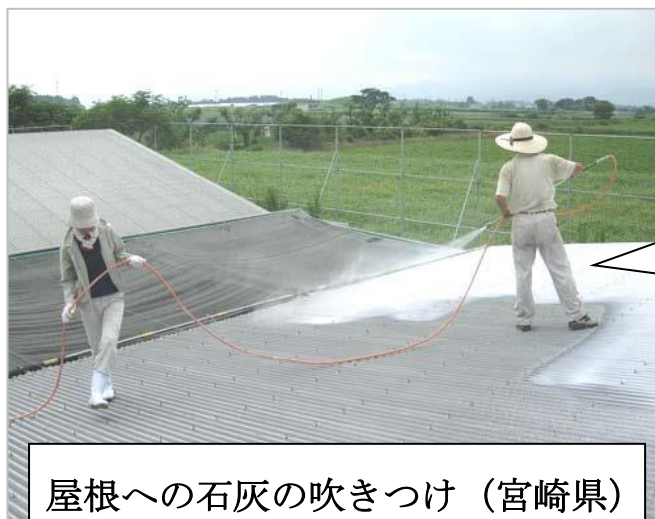
屋根への石灰の吹きつけ (宮崎県)