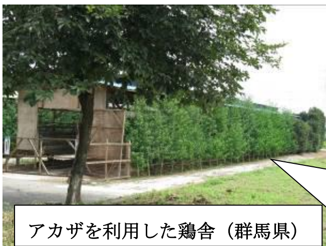
アカザを利用した鶏舎 (群馬県)