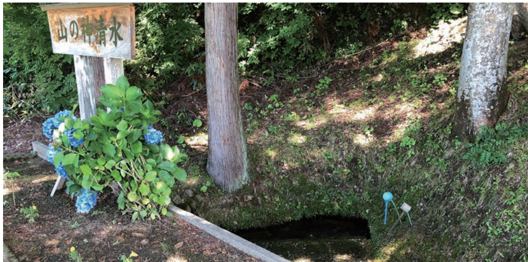
〔管理者〕共有地管理会 〔保全団体〕三日町自治会