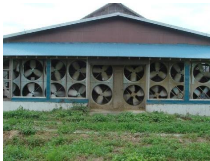
換気扇、送風機の稼働