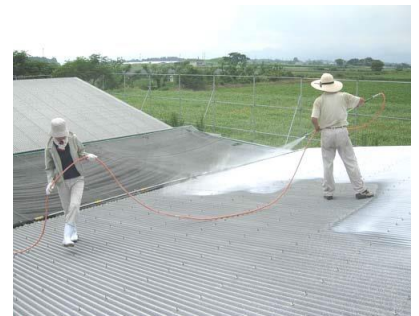
屋根への石灰塗布