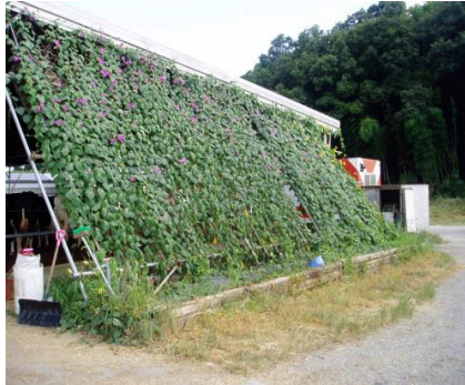
グリーンカーテンの設置