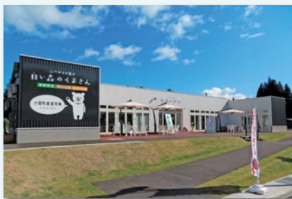
道の駅白い森小国「白い森のくまさん」 (農産物直売所)