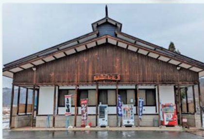
水の郷交流館 (お食事処)