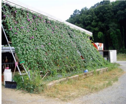
グリーンカーテンの設置