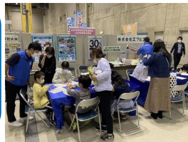
令和4年度「やまがた環境展」出展の様子(株式会社エフピコ)

3年振りに開催した令和4年度「やまがた環境展」では3団体がブース出展し、来場者に団体が提供する環境学習内容を体験していただきました。