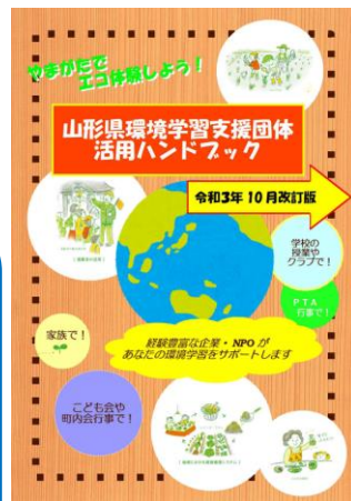
活用ハンドブック