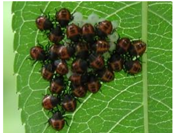
写真2 クサギカメムシ卵塊とふ化幼虫