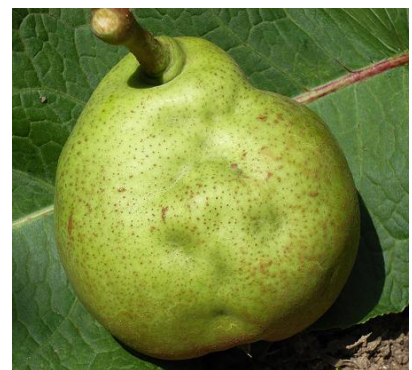
写真3 西洋なしの被害果