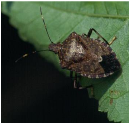
写真1 クサギカメムシ成虫

ア. 気温や湿度の高い日に果樹カメムシ類の園内への飛来や吸汁加害が多くなる傾向がある。 園内をこまめに見回り、樹上の寄生や被害果の発生に注意する。 イ. 園内で成幼虫の寄生や卵塊、被害果が確認される場合は、速やかに捕殺や薬剤散布を行う。 また、加害は収穫期まで長期間にわたるので、園内の見回りを継続する。 ウ. 台風の通過後に、園内に多飛来する場合がありますので注意する。 エ. 薬剤の選定に当たっては、「山形県病虫害防除基準」を参照し、果樹カメムシ類に効果のある剤で防除を実施する。なお、薬剤抵抗性出現を防止するため、同一系統の薬剤の連用を避ける。