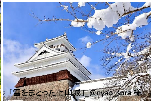
「雪をまとった上山城」_@nyao_sora 様