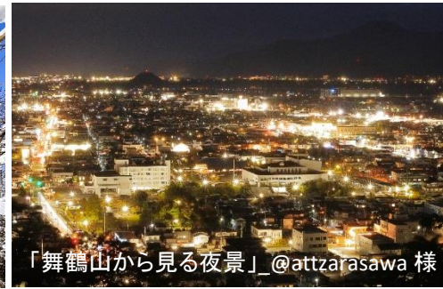
「舞鶴山から見る夜景」_@attzarasawa 様