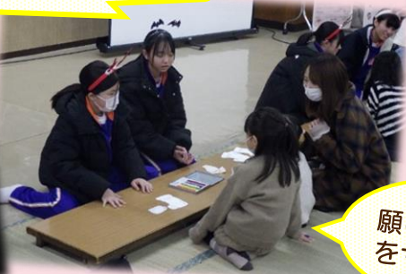
願い事の記入をサポート📝