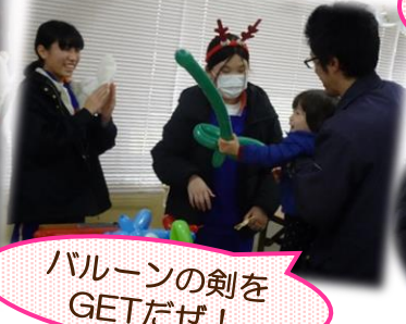
バルーンの剣をGETだぜ！