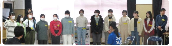
「nicoこえ」 (山形県青年の家)