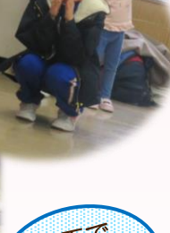
お玉でピンポン運び！