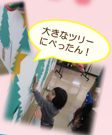
大きなツリーにぺったん！