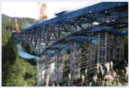
整備が進む羽黒山バイパスの(仮称)羽黒山橋。「出羽三山神社」に向かう大型観光バスなどが快適に通行できるようになります。

そして、いよいよ東根IC(仮称)根北IC間、南陽高島IC(仮称)山形上山IC間が開通します。この区間の開通で福島市、山形市、仙台市の南東北3県の県庁所在地を結ぶ環状ネットワークが形成されます。これにより、観光誘客や交流人口の拡大、産業振興が期待されます。また、供用率は76%となり、ミッシングリンクは6カ所に減ります。