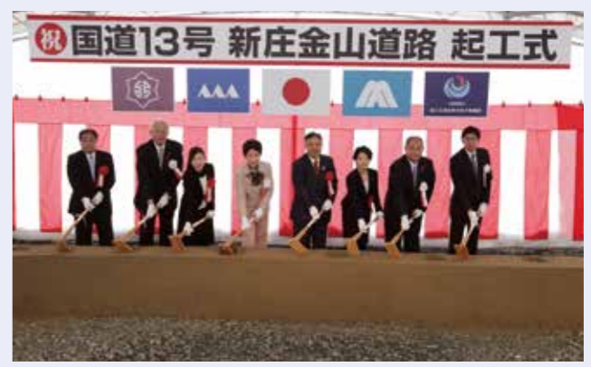
新庄金山道路で起工式が行われました 平成30年12月9日

そして、いよいよ東根IC(仮称)根北IC間、南陽高島IC(仮称)山形上山IC間が開通します。この区間の開通で福島市、山形市、仙台市の南東北3県の県庁所在地を結ぶ環状ネットワークが形成されます。これにより、観光誘客や交流人口の拡大、産業振興が期待されます。また、供用率は76%となり、ミッシングリンクは6カ所に減ります。