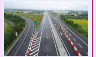
1 東根IC～東根北IC