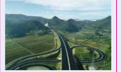
2 南陽高島IC～山形上山IC