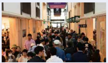
にぎわう道の駅「米沢」