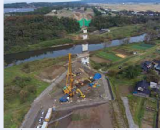
工事が進む酒田みなとIC～(仮称)遊佐鳥海IC

現在、国土交通省により、酒田みなとIC(仮称)遊佐鳥海IC間、秋田県境、新潟県境で工事が進められており、県でも、事業用地取得に協力しています。