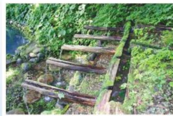
写真：五本樋(朝日町)(平成28年度選定)