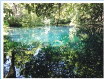
写真：丸池様(遊佐町)(平成29年度選定)