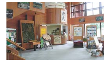
ようこそネイチャーセンターへ