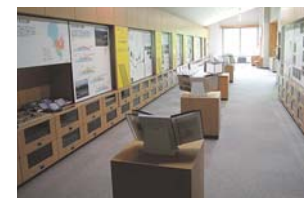
月山をとりまく環境を学ぼう