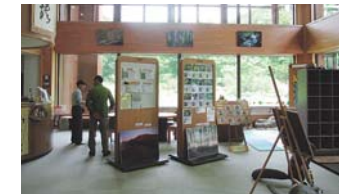
旬の情報を発信します