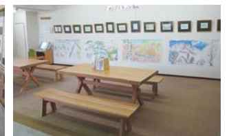
自然をみつめるギャラリー