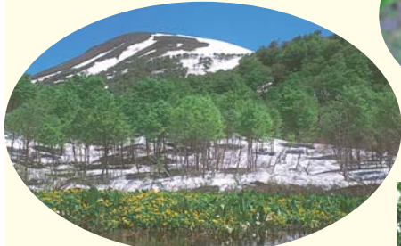
リュウキンカ広場と姥ヶ岳