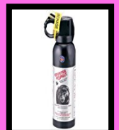
クマ撃退スプレー