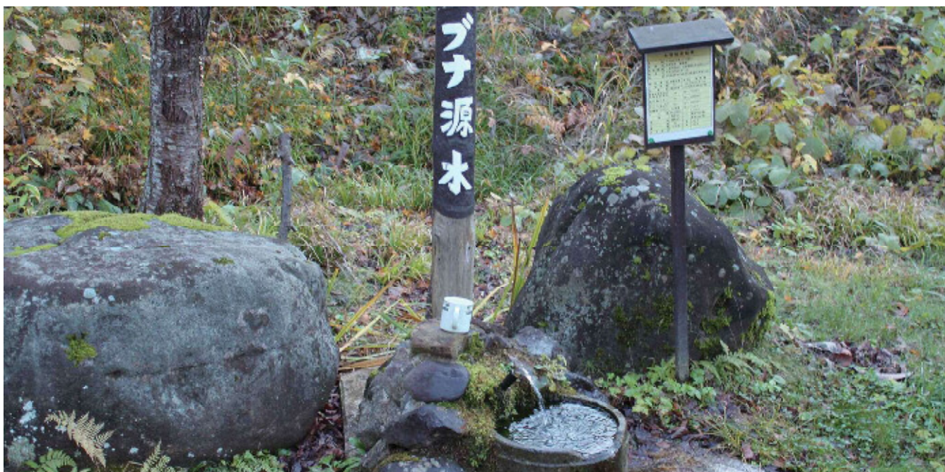
〔管理者〕 寺町生産森林組合 〔保全体〕 寺町地区