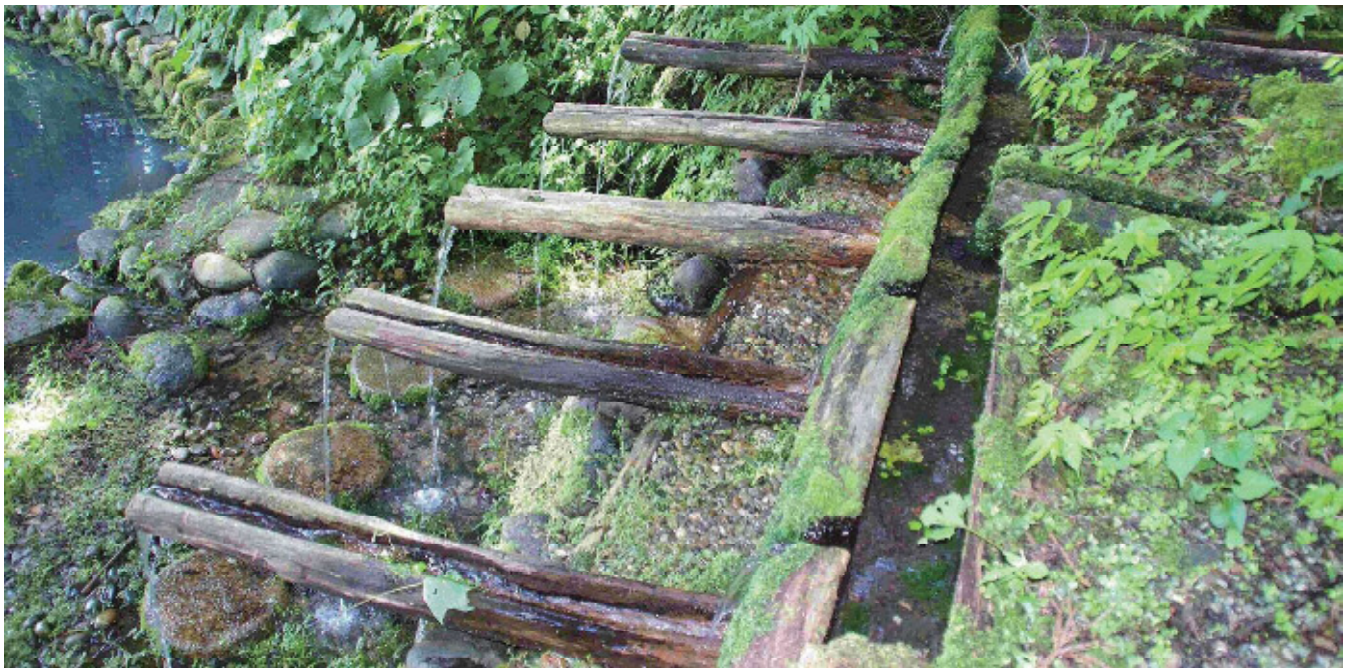
〔管理者・保全団体〕 八ツ沼区