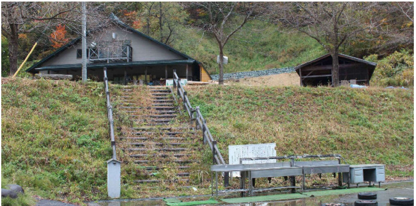
〔管理者・保全団体〕樽石大学