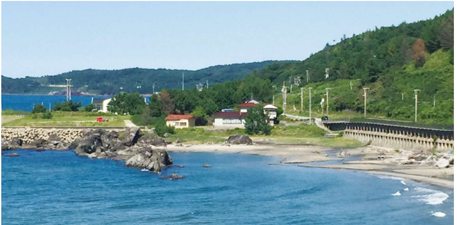
〔管理者〕山形県 〔保全団体〕吹浦地区まちづくり協議会