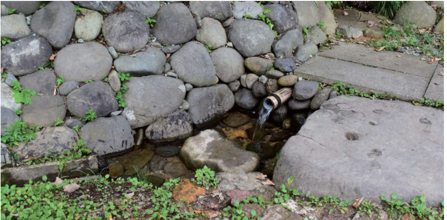
〔管理者・保全団体〕母袋地区