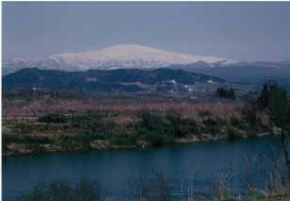
地域のシンボル「月山、最上川」の眺望 (寒河江市から)