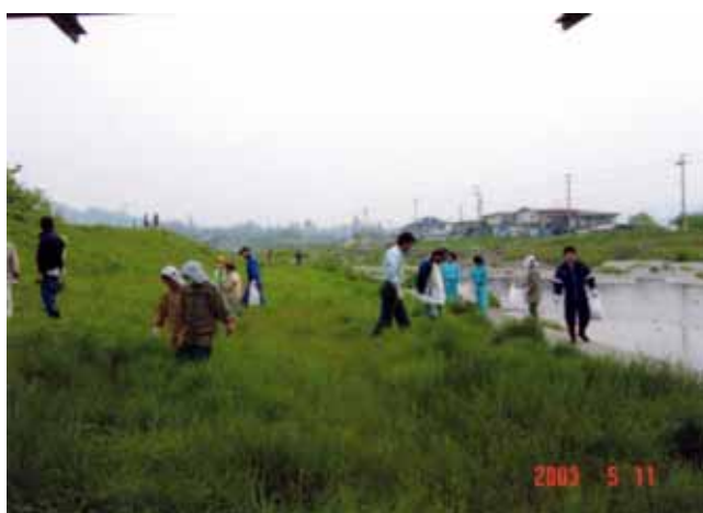
河川アダプト「河川敷ゴミ拾い」須川(上市市)