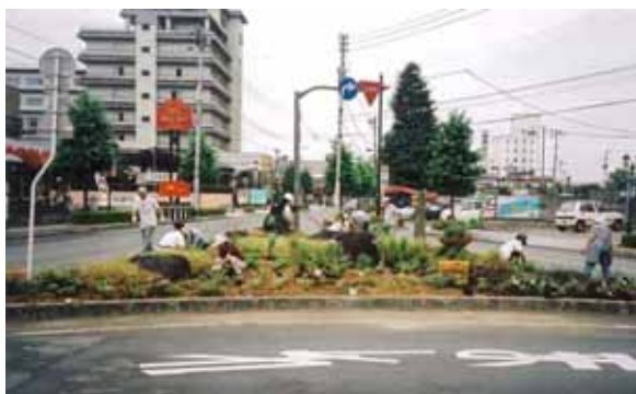
道路美化活動「町内花いっぱい運動」 一般県道天童停車場若松線(天童市)