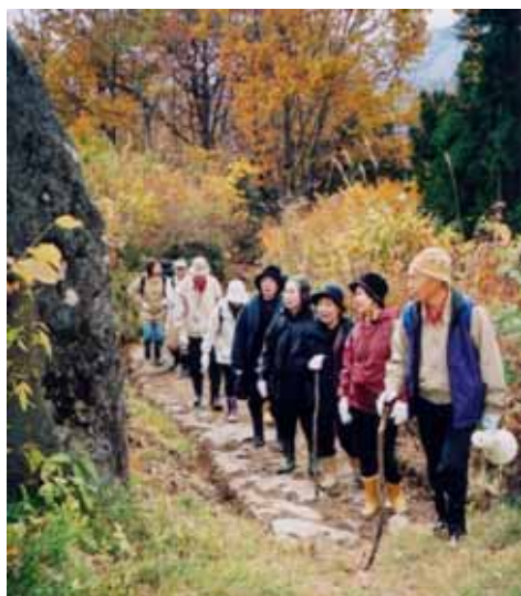
地域活動「六十里越街道トレッキング」(西川町)

このようにして、多種多彩な力が結集し、地域活力の源泉となり、ものを作り、使い続けながら「楽しい山形」が創造されている社会が実現する。