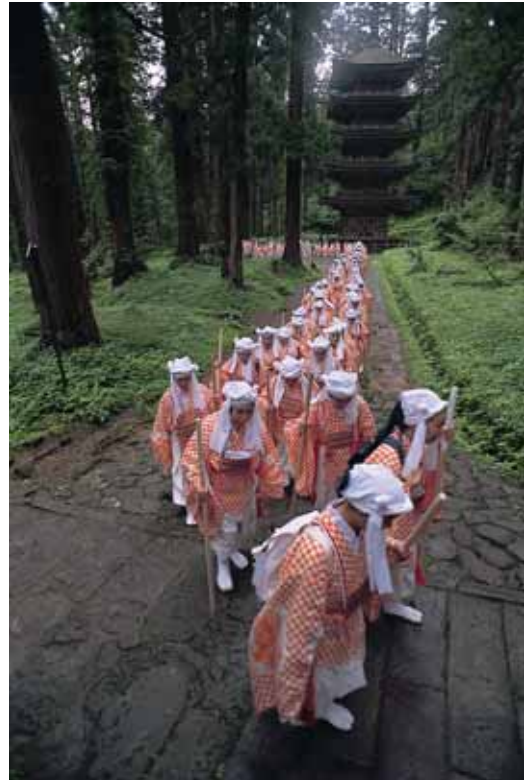
出羽三山御子修行 (鶴岡市)