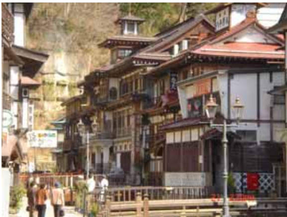
景観整備を進めた「銀山温泉」(尾花沢市)