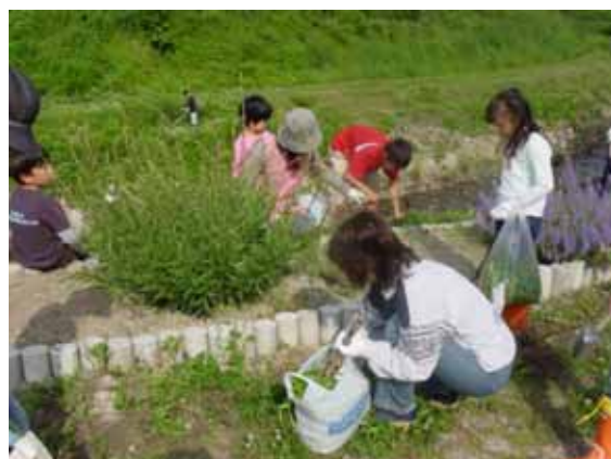
河川アダプト「子どもたちといっしょの美化活動」 法師川(河北町)