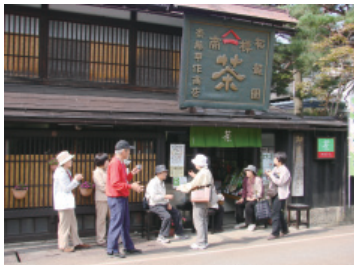
▲まちなか巡りのひとコマ

歴史的建造物、文化、食などの魅力ある地域資源を活用し、まちを楽しむ「まちなか巡り」のコースづくりなどを行い、内外の交流人口の拡大を図ります。