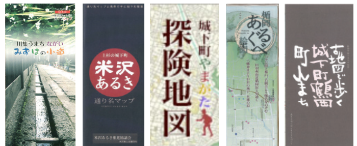
▶マップづくりの例