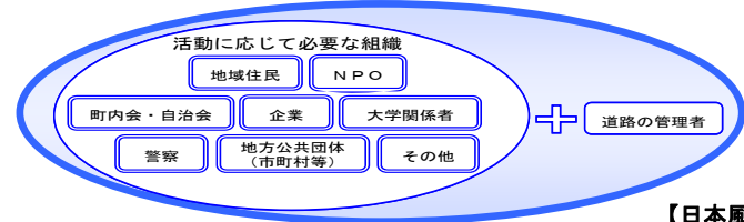
【日本風景街道パートナーシップ】