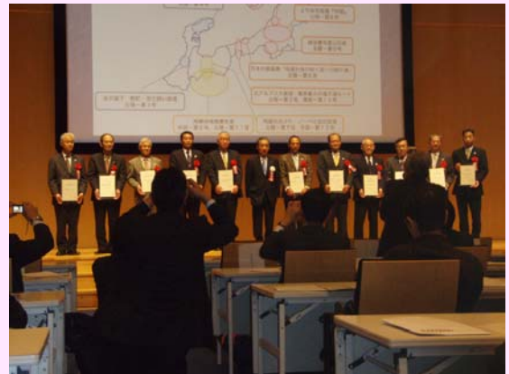
記念撮影(全登録箇所)