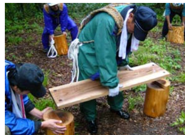
▲展望空間の整備 (ベンチの設置)