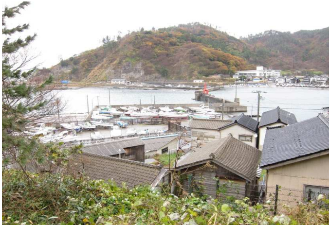
No 2 鶴岡市加茂地区のまちなみ