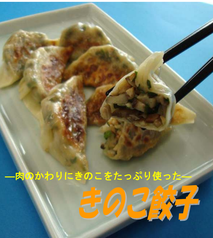
—肉のかわりにきのこをたっぷり使った—

きのこは、低カロリーで食物繊維が多く含まれていることはよく知られています。お肉の代わりに、きのこを使った餃子を作ってみませんか？野菜もたっぷりとれるので、メタボが気になる方にもおすすめレシピです。