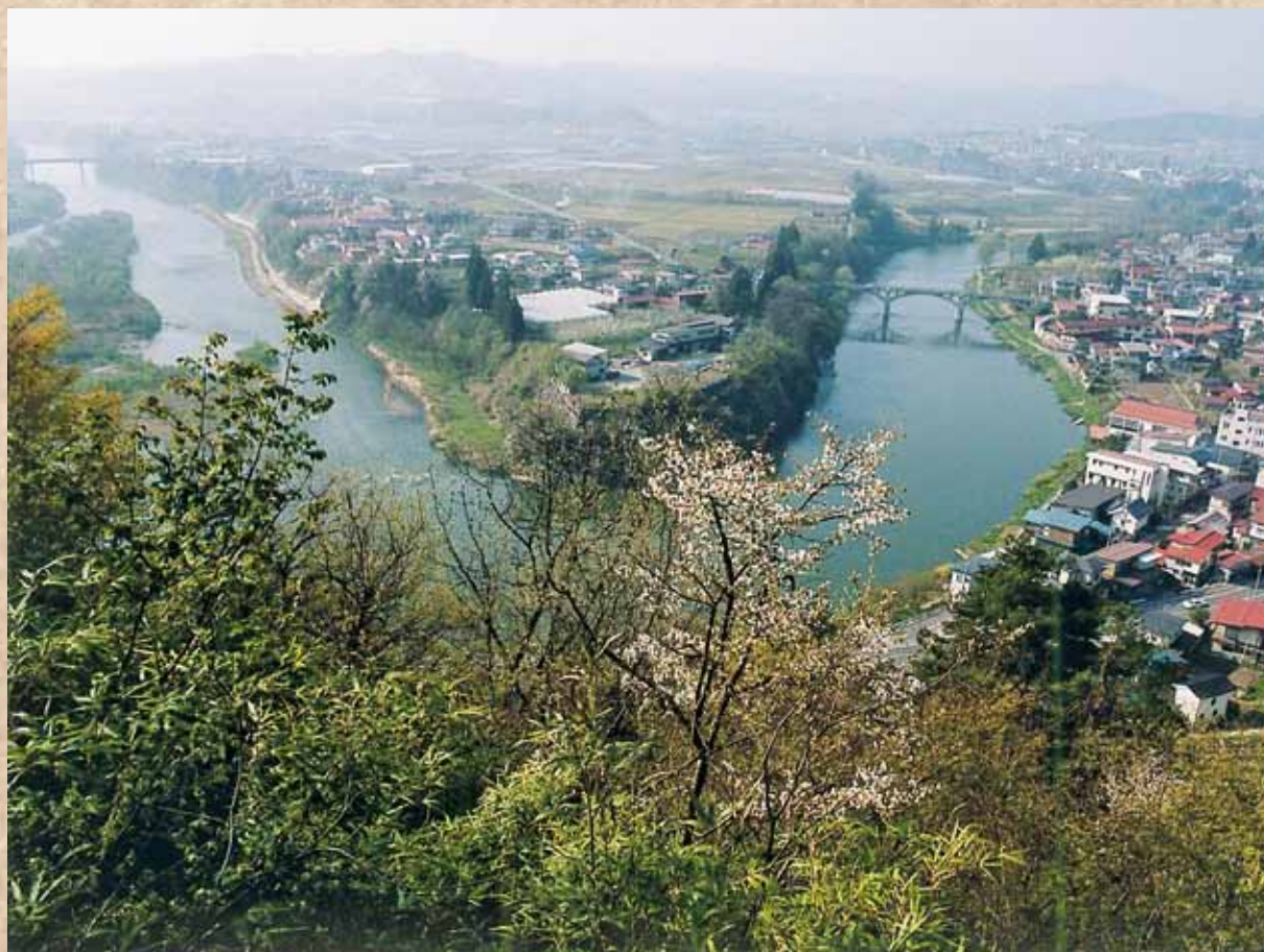
「最上川の眺望：大江町」

～ 一人一人へのきめ細かな指導とコミュニケーションを大切にした教育活動の推進 ～