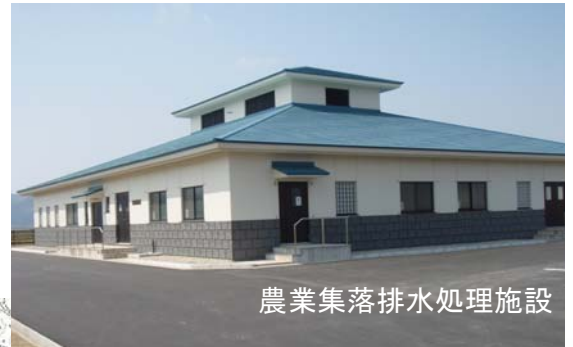
農業集落排水処理施設

事業期間 H14～H20 事業費 1,754百万円 処理人口 1,800人 422戸 整備内容 処理施設 1式 管路施設 L=14,030m 中継ポンプ 12箇所