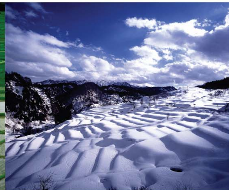
第2回四ヶ村棚田写真コンテスト 入選 新庄市 / 吉田正豊