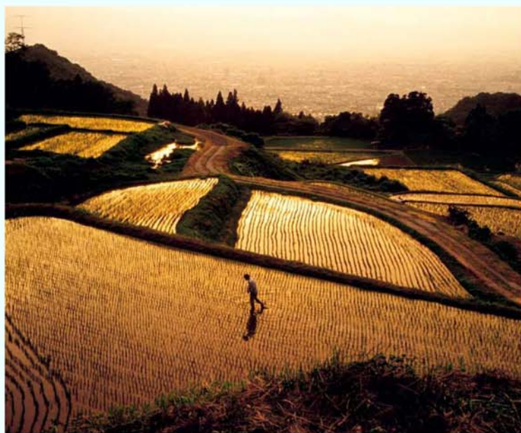
第10回 入選 山形市 / 阿部武代 「黄昏の棚田」(山形市)