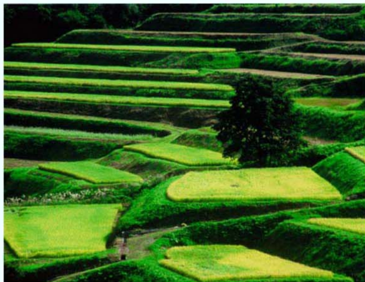
第14回 棚田百選の部 特選 山形市 / 金沢茂夫 「稔の秋」(大蔵村)