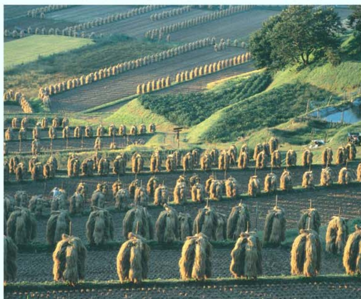
第11回 入選 東根市 / 横尾範昭 「棚田の夕景」(山辺町)