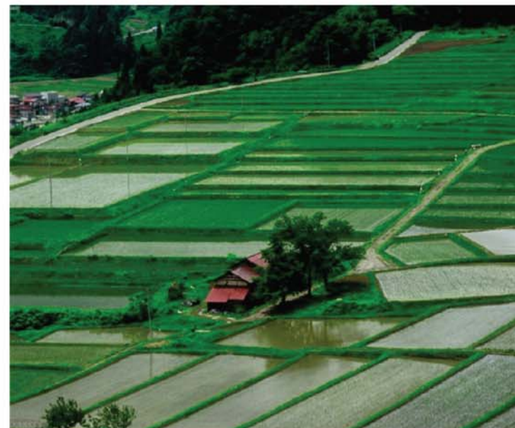
第14回やまがた農村フォトコンテスト 棚田百選の部 特選 山形市 / 大場幸太郎 [薫風の頃(一本松公園から)]