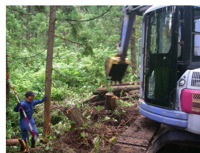
根株を盛土補強材として配置