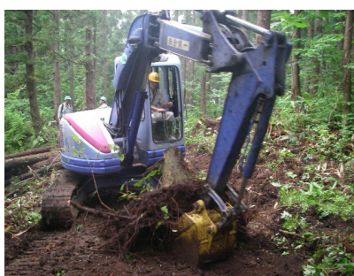
根株の扱いに苦戦する研修生