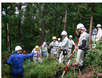
5日間で120名を超える参加者