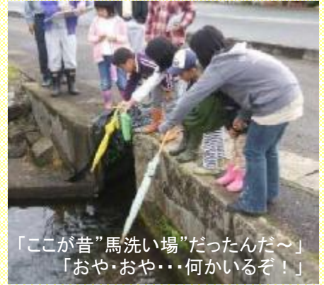
「ここが昔”馬洗い場”だったんだ～」 「おや・おや…何かいるぞ！」