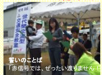
誓いのことば 「赤信号では、ぜったい渡りません！」