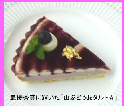
最優秀賞に輝いた「山ぶどうdeタルト☆」