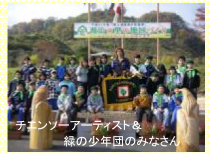
チェンソーアーティスト & 緑の少年団のみなさん