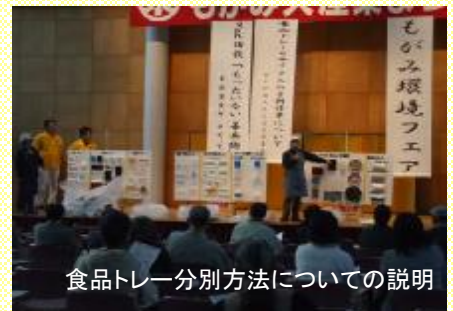
食品トレー分別方法についての説明