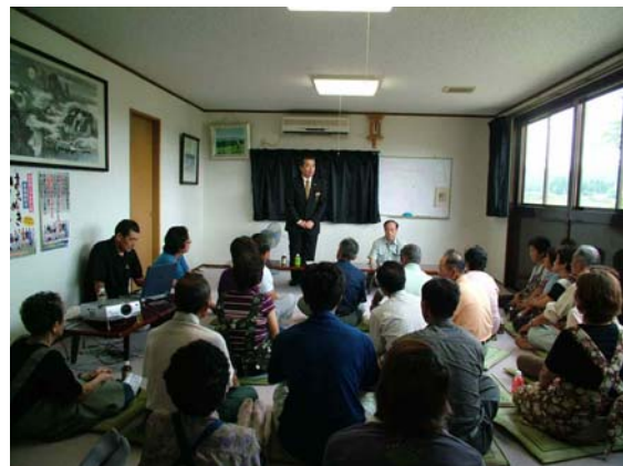
戸沢村野口公民館にて