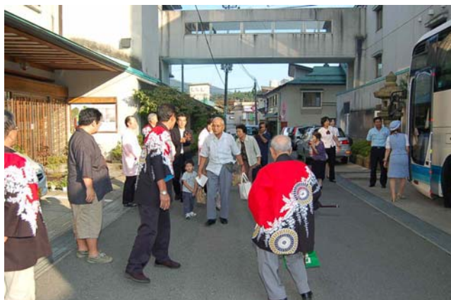
赤倉温泉でのお出迎えの様子