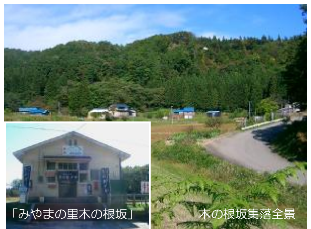
「みやまの里木の根坂」