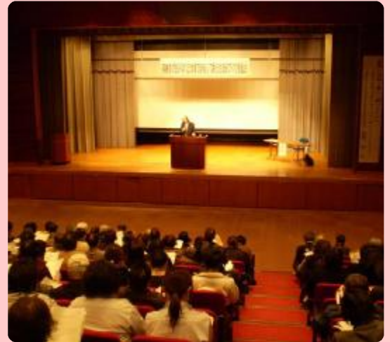
新庄市民プラザにて