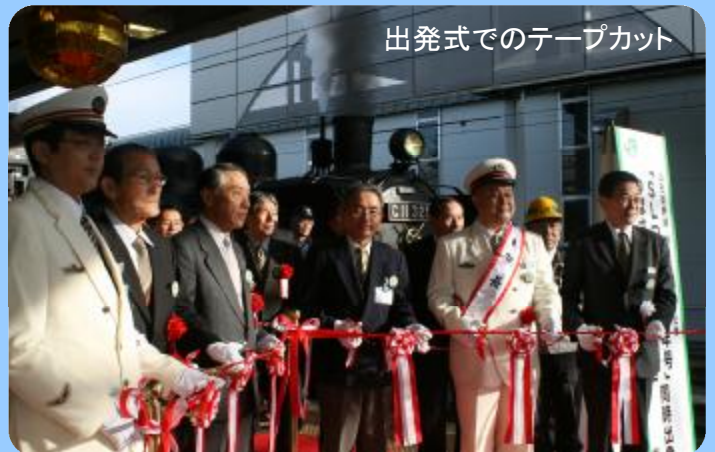
出発式でのテープカット