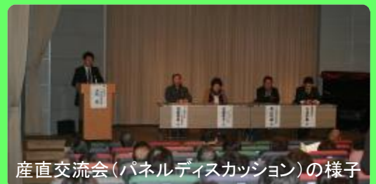
産直交流会(パネルディスカッション)の様子