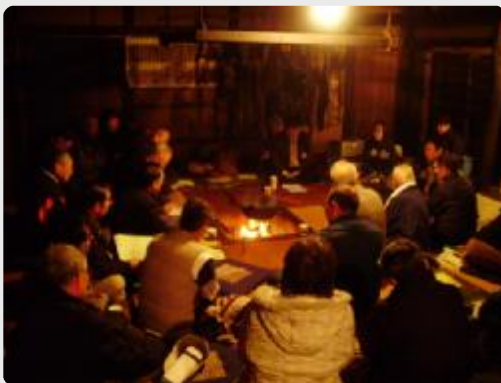
国指定重要文化財「旧矢作家住宅」にて

第8回最上地域バイオマスフォーラムを国指定重要文化財「旧矢作家住宅」において12月5日(土)に開催しました。