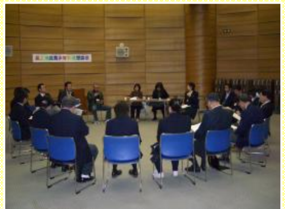
新庄市民プラザにて