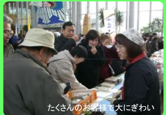
たくさんのお客様で大にぎわい

この3地域の合同PRイベント「東北のへそ産直まつり」が、山形新幹線新庄延伸10周年記念に合わせ、12月5日(土)、最上広域交流センター「ゆめりあ」を会場に開催されました。3つの地域から25の産直団体が出店し、約6,900人のお客様が訪れにぎわいました。また、旅行業者も交えた「産直交流会」が同時開催され、観光資源としての産直の将来像について意見を交わしました。