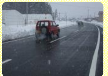
12月22日に供用開始された2期区間