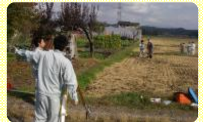
真剣に測量に取り組む生徒たち