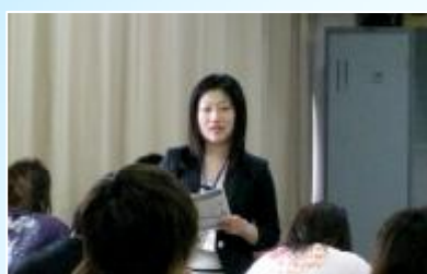
困ったときはまず相談してください