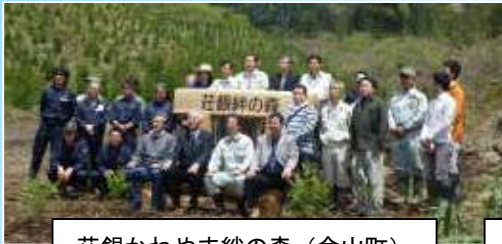
荘銀かねやま絆の森 (金山町)