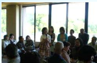
学んだことをグループごとに発表しました