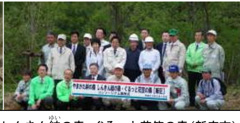
しんきん結の森・ぐるっと花笠の森(新庄市)