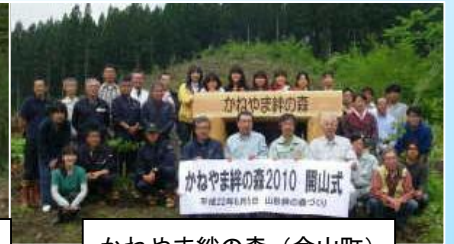
かねやま絆の森 (金山町)