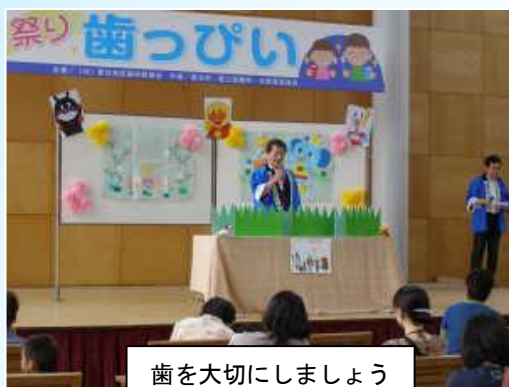
歯を大切にしましょう