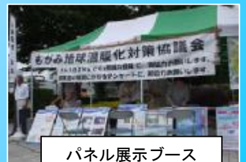
パネル展示ブース