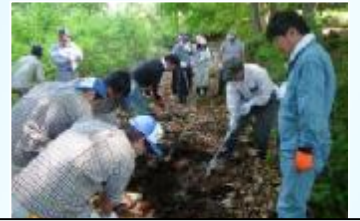
マイタケホダ木の伏せ込み実習