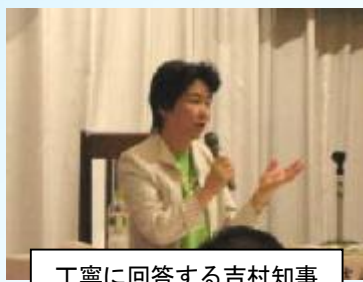
丁寧に回答する吉村知事

6月1日（火）、「知事と語ろう市町村ミーティング in まむろ川」が真室川町のイベントハウス遊楽館で開かれ、町民約140人と知事が地域の課題について話し合いました。