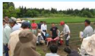
熱心に勉強する生産者たち

生産者の農家はいずれも本格的なねぎの栽培は初めてですが、産地化の成功に向けてお互いに協力しながら真剣に取り組んでいます。