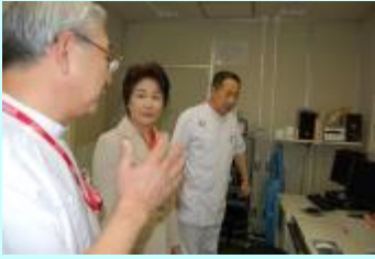
県立新庄病院視察