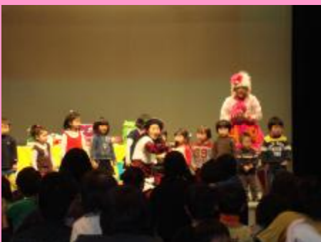
新庄市民文化会館にて

12月26日(土)、新庄市民文化会館を会場に、「親子ふれあいコンサート」が開催されました。このコンサートは、最上地域の子育て支援団体等で構成する「もがみ子育て支援ネットワーク連絡協議会」が主催するもので、親子のふれあい・親同士の交流等を促進し、地域における子育て支援ネットワークの輪を広げる事を目的としています。