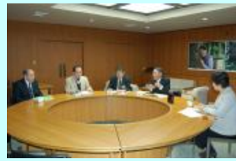
最上地域における課題についての意見交換会