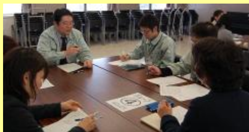
最上総合支庁講堂にて

1月26日(火)最上総合支庁講堂を会場に、最上総合支庁等で勤務する職員32名が参加し、接遇向上研修会を開催しました。最上総合支庁では、平成17年度から「WILL最上※」を目標に掲げ、職員の接遇向上と意識改革、より良い行政サービスを提供するための取り組みを行っております。