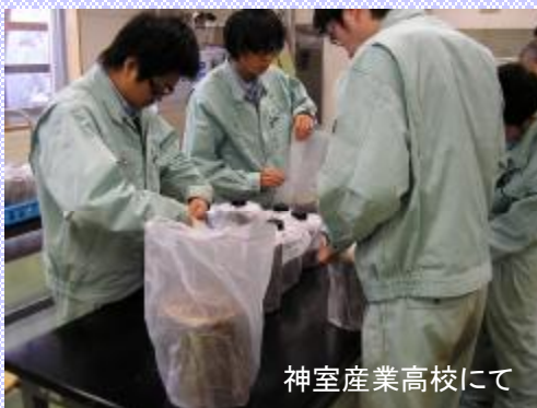
神室産業高校にて

報告の後には、活発な意見交換が行われ、森づくりに取り組む方たちの絆を深め、最上の豊かな自然を後世に引き継ぐことを確認する場となりました。