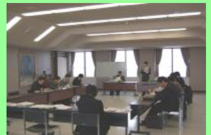
最上総合支庁講堂にて