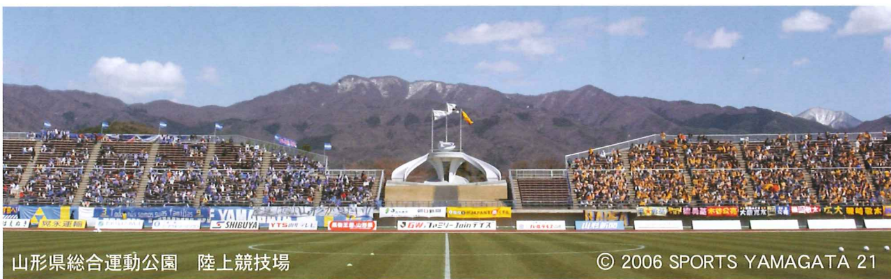
山形県総合運動公園 陸上競技場