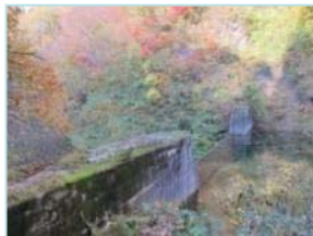
▲直上流の砂防堰堤

◆問い合わせ先：山形県最上総合支庁建設部 河川砂防課 最上小国川流水型ダム建設室 【TEL】 0233-29-1413