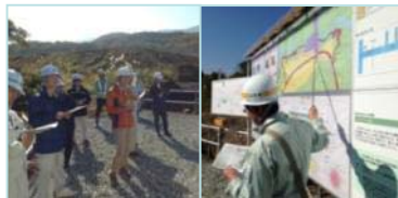
▲現場見学会の様子