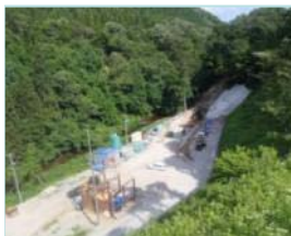
▲下流工用道路付近からの工事現場眺望（※H26.7現在）

※ 工事中の安全確保のため、工用道路や仮設ヤードについては、進入禁止の措置をとらせて頂いております。ご了承ください。