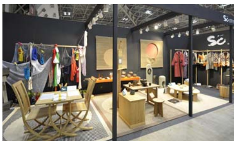
9月上旬、東京ビッグサイトで開催されたギフト・ショーの様子

MURAYAMA未来塾では、村山地域の地場産業事業者の方々が異業種連携による新たなものづくりに取り組んでいます。このたび、MURAYAMA