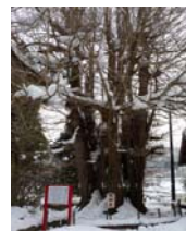
山寺の大イチョウ（山形市指定天然記念物） 山寺の神社日枝境内の南東隅にあります。 根周り凡そ10m、幹周り凡そ9.6m、圧巻です。