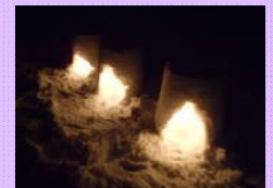
2月は、県内各地で雪のイベントが開催されます。

■発行元■ 村山総合支庁総務企画部 総務課総合相談係 Tel. 023-621-8288 Fax.023-621-8268