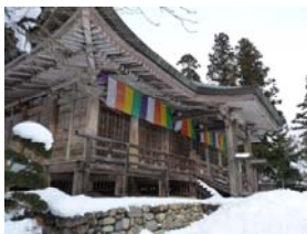
山寺立石寺根本中堂（国指定重要文化財） ブナ材の建築としては日本最古です。