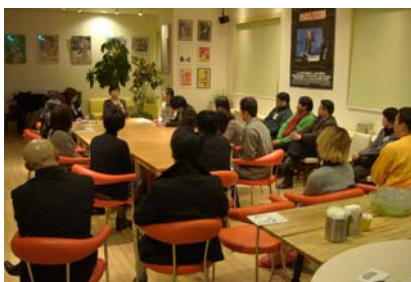
↑第1部トーク・ライブで青山さんの話に聞き入る参加者のみなさん。

村山地方で地域に根差してがんばっている若い人たちが、お互いを知り、学び、交流を深めるために開催した「トーク・ライブ&ラーニング・バー」。当日は、第1回に引き続き参加してくれた方や、雪の降る悪天候ながら西川町から駆けつけてくれた方など、19名の参加者が集まってくれました。