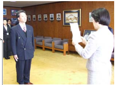
表彰式が行われました。