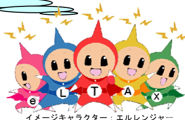
イメージキャラクター：エルレンジャー

税理士による代理申告の場合、納税者（法人の代表者等） 本人の電子証明書が不要になりました。