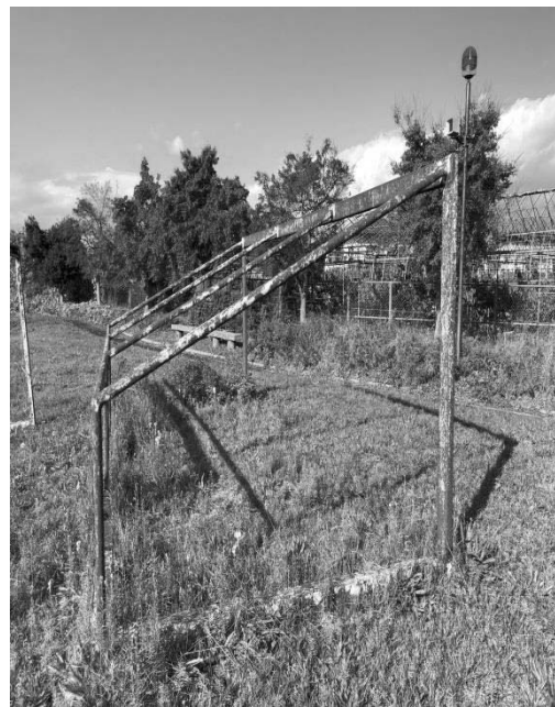
(写真：サッカーゴール)