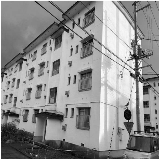
(写真：鈴木第2アパート外観)