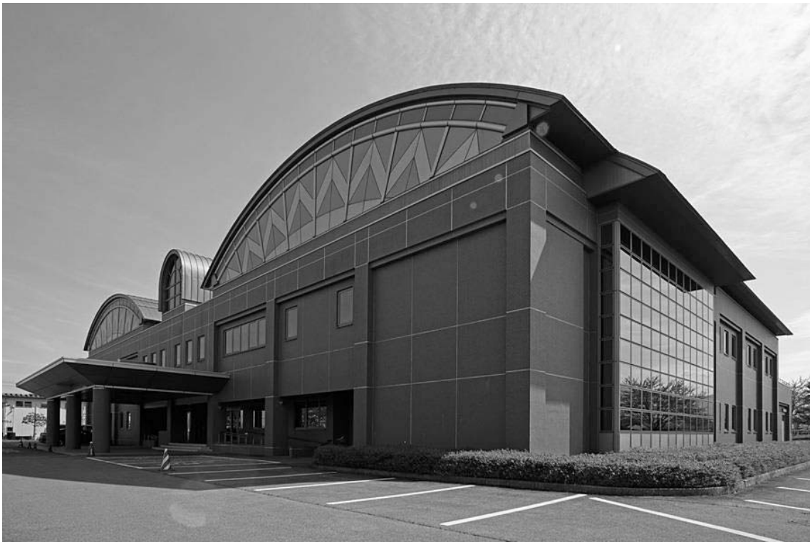
(写真：産業創造支援センター全景)