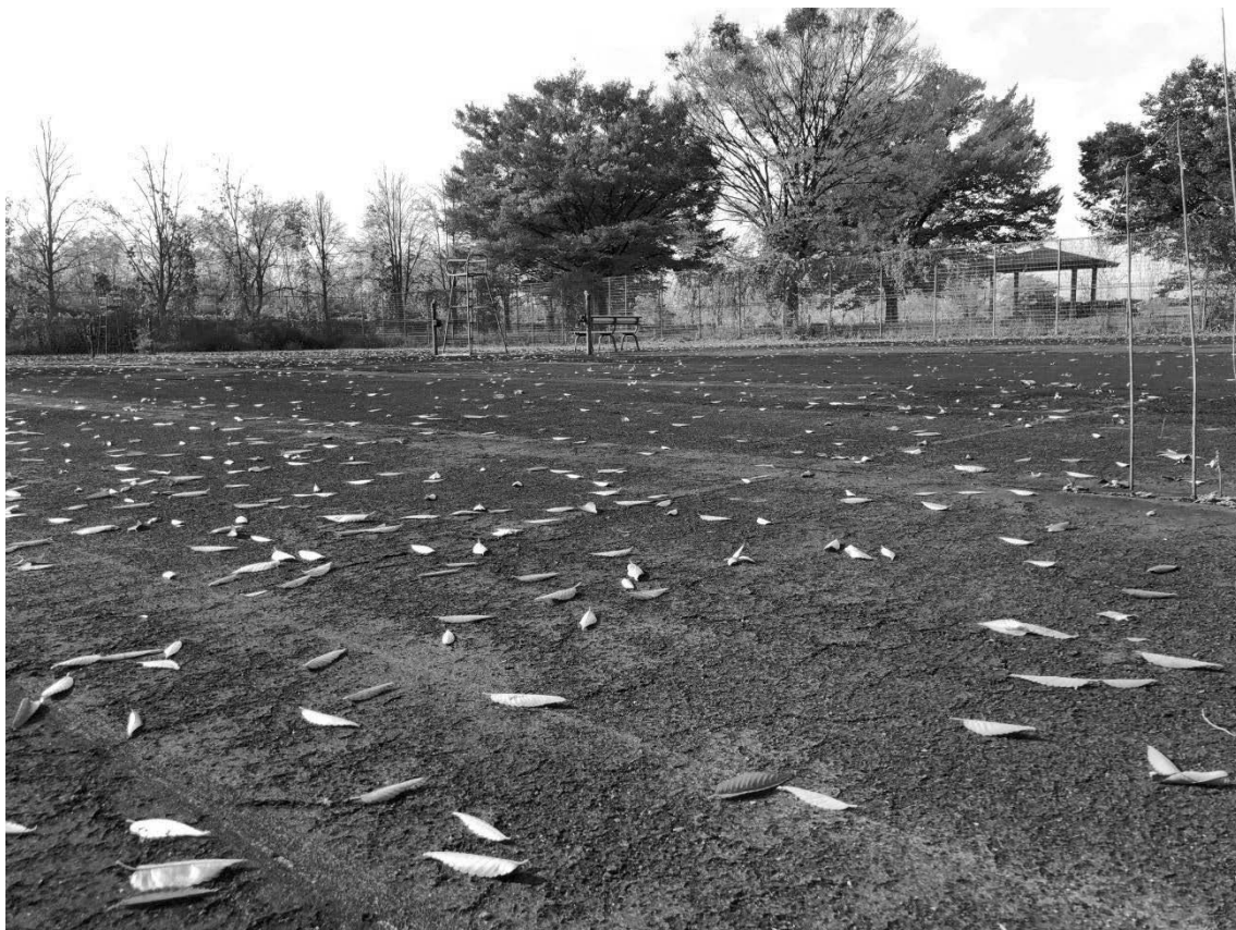
(写真：利用停止のテニスコート)

当該施設は開設より 30 年近く経過しており、施設全般につき老朽化が進んでいる。事業継続のためには、大規模な修繕や設備投資が必要となると考えられる。