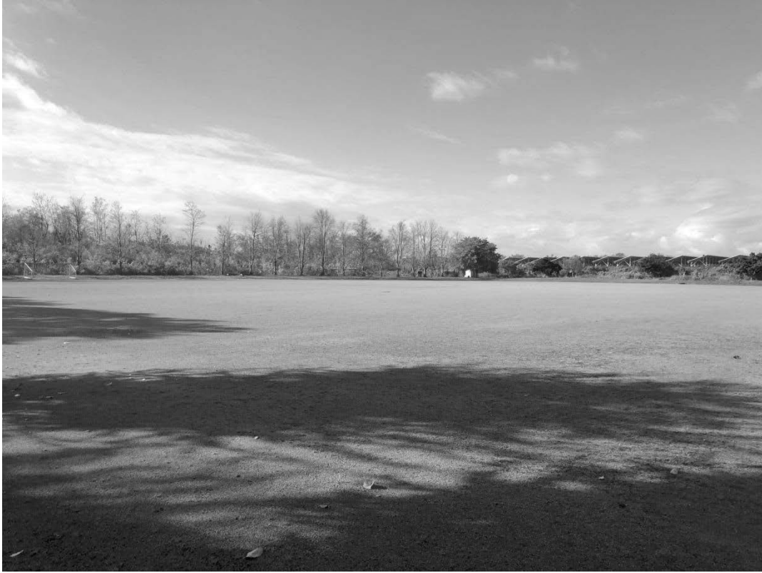
(写真：ふるさと交流広場 多目的広場)