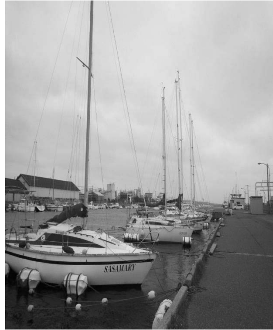
(写真：第2酒田プレジャーボートスポット)