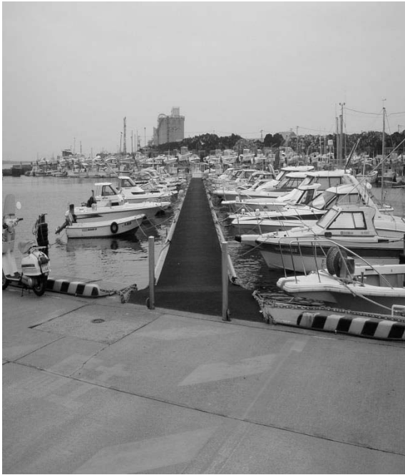
(写真：第1酒田プレジャーボートスポット)