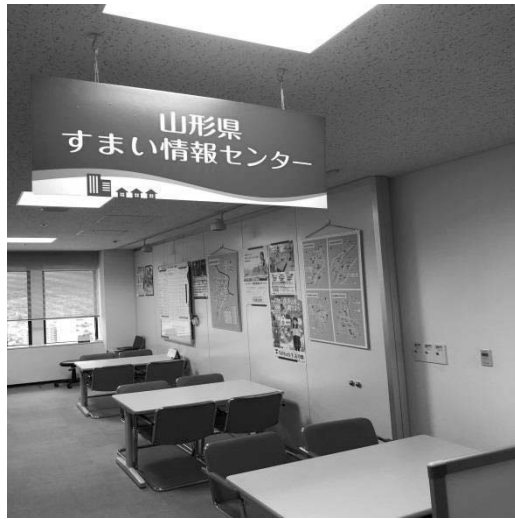
(写真：すまい情報センター応接場所)