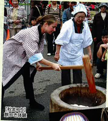
【秋まつり】餅つき体験

募集型企画旅行 (株)日本海トラベル 登録 3-168 国内旅行業務取扱主任者/後藤 紀