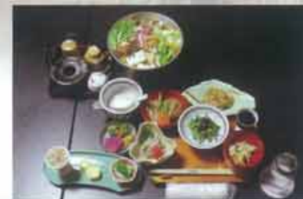
期間限定 「雪旅籠御膳」