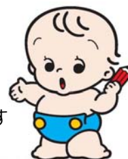
国勢調査キャラクター センサスくん

若者?...キャラバン隊のメンバーは「大学生」です エコ?...環境負荷の少ない「自転車」で縦断します