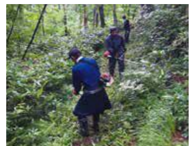
いちねんぼう 登山道の下刈り(一念峰)