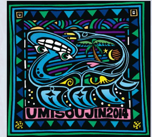
「うみそうじん」