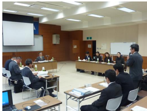
山形県公共事業評価監視委員会の状況