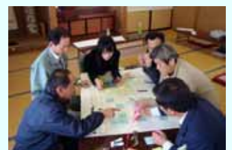
地域づくりワークショップなどの 企画、運営を支援

山形県では、農山漁村元気づくり 応援プランを掲げ、元気ある地域づ くりを推進している。これらの地域 づくりワークショップ等を企画運営 できる人材として、県が定めた現 場、企画、実践研修を終了した職 員をプランナーとして認定し、地域 づくりを支援している。