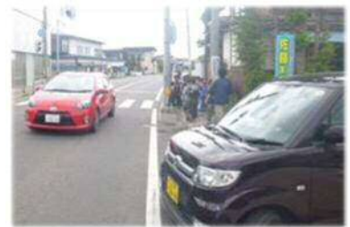
狭い歩行空間と通学児童