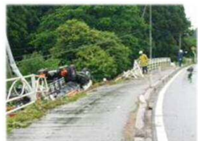
交通事故の発生状況