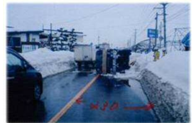
冬期幅員狭小による横断事故も発生