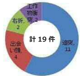
本区間での交通事故発生状況 (件/4年) (H22-25)