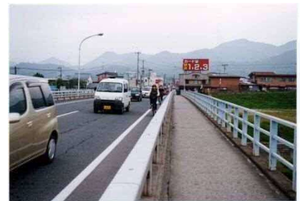
架替前の馬見ヶ崎橋