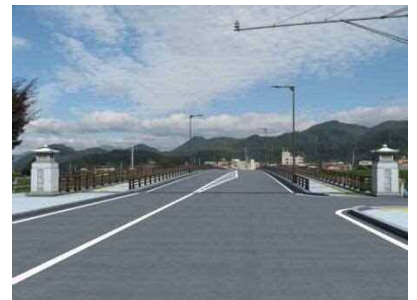
馬見ヶ崎橋完成予想図